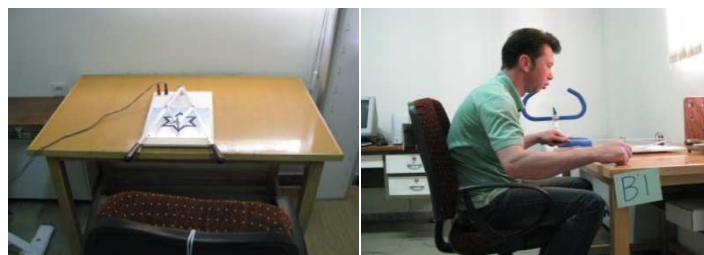
شکل ۱: آزمون هماهنگی دو دست و یک فرد آزمایش شونده

داده‌های به دست آمده در این مطالعه از نوع کمی بود که با اندازه‌گیری زمان انجام آزمون هماهنگی دو دست (۱۸)، عملکرد محاسبه گردید. جهت اندازه‌گیری زمان آزمون بدین صورت عمل می‌گردد که سه بلندگو (چند منبع) به فاصله ۱/۵ متری طرفین و پشت سر آزمایش شونده قرار گرفته (۱۷) و در هر موقعیت شدت صوتی با تراز ثابت با استفاده از نرم‌افزار Gold wave ایجاد گردید (۱۶) و پس از مدت زمان ۵ دقیقه تماس با صدا توانایی عملکرد فرد با انجام آزمون هماهنگی دو دست ارزیابی شد که این آزمون برای ارزیابی توانایی حرکت هر دو دست به طور هماهنگ می‌باشد و ارزیابی بر پایه مدت زمان انجام و تعداد خطاها محاسبه می‌گردد. از شرکت کننده خواسته می‌شود الگویی را با استفاده از دو اهرم بر روی صفحه دنبال