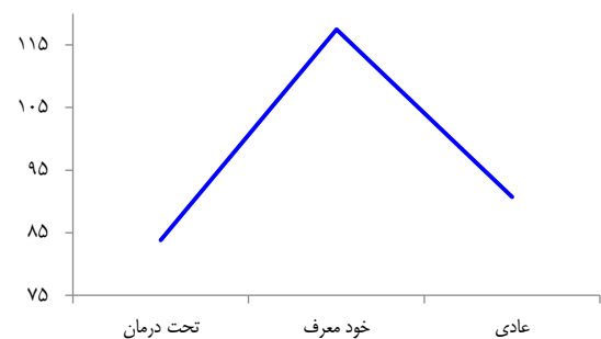
شکل ۲. تفاوت بین میانگین گروه‌ها در متغیر دشواری در نظم‌بخشی هیجانی